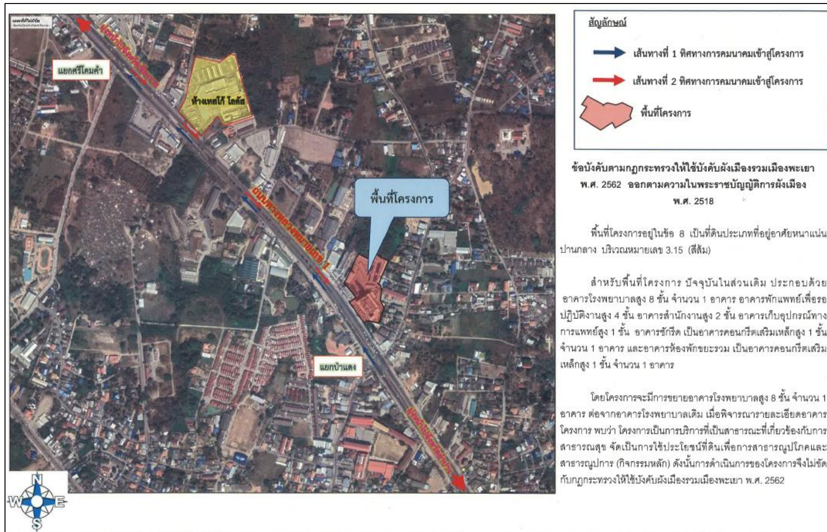
รูปที่ 2.1.1-1 ที่ตั้งและเส้นทางการคมนาคมเข้าสู่พื้นที่โครงการ