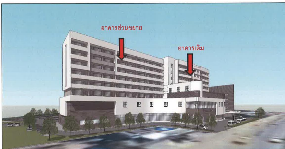
รูปที่ 2.3.1-1 รูปแบบอาคาร โครงการ โรงพยาบาลพะเยา งาม

โครงการ โรงพยาบาลพะเยา งาม (ส่วนขยาย) มีรูปแบบอาคารเป็นแบบทันสมัย (Modern Style) ออกแบบให้ทุกส่วนของพื้นที่อาคารมีการใช้ประโยชน์ที่ลงตัว มีการจัดภูมิทัศน์ให้สวยงามจัดให้มีพื้นที่สีเขียวรอบโครงการ เพื่อเพิ่มความร่มรื่นให้แก่อาคาร แสดงดังรูปที่ 2.3.1-1